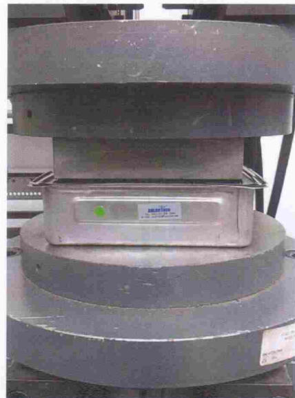
그림 2. 압축시험