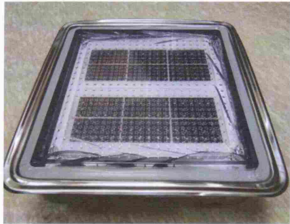
그림 1. 시험품 사진(왼쪽부터 시험 전, 시험 후)